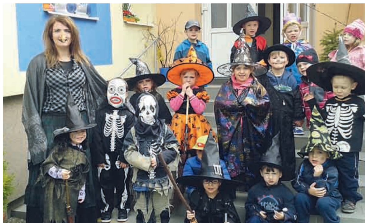
Naše čarodějnice nám nikam neuletěly, jen si společně zatančily a zasoutěžily. Jak nám to slušelo, posuďte samy!