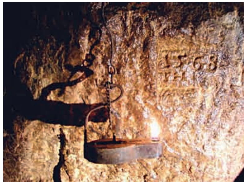
Štola Mikulov – nejstarší dochovaný letopočet 1563

také Uhelné safari, další ojedinělý projekt spojený s Krušnohořím. Přípravou jsou pro vás tři okruhy, které vás zavedou na místa, kde se dobývalo a dodnes někde dobývá hnědé uhlí a také tam, kde je již těžbou dotčená krajina od nerozeznání od okolní přírody. Terénní vozidlo vás zaveze do hloubky 200 metrů, kde si budete moci prohlédnout těžební velkstroje, např. unikátní skryvkové rypadlo RK 500. Prohlídka také nabízí pohled na jednotlivé geologické vrstvy, odkryté při těžbě. Po zhlédnutí velkstrojů v akci a při troše štěstí také stád muflonů, můžete shlédnout úspěchy rekulivačních prací v podobě golfového hřiště, hipodromu nebo jezera Matylda. Při návštěvě štol a projížďce uhelným safari vám přejeme poutavé a poučné zážitky.