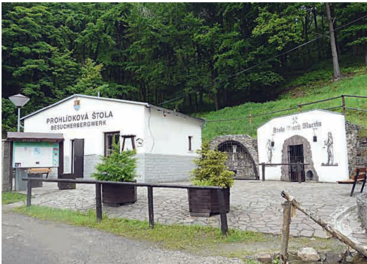
Štola Starý Martin

Štola Starý Martin v Krupce a štola Lehnschafter v Mikulově nabízí zajímavý pohled na historii rudného dolování od dob středověku a určitě obě stojí za letní výlet pro celou rodinu, i když ta mikulovská je spíše pro dobrodružnější povahy. A pokud budete mít v létě chuť na další zajímavé zážitky spojené s hornictvím, navštivte