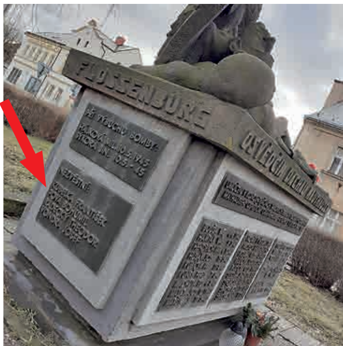
V Lomu před kostelem Nejsvětější srdce Páně stojí památník obětem koncentračních táborů, který připomíná oběti boje proti nacismu. Mezi nezvěstnými figuruje i jméno Bohumil Pova. My už dnes víme, že památník, vzniklý v roce 1946 podle sochaře Karla Zentnera, neuvádí celou pravdu. Lomský rodák Bohumil Pova zahynul 24. srpna 1944 během náletu na Buchenwald.