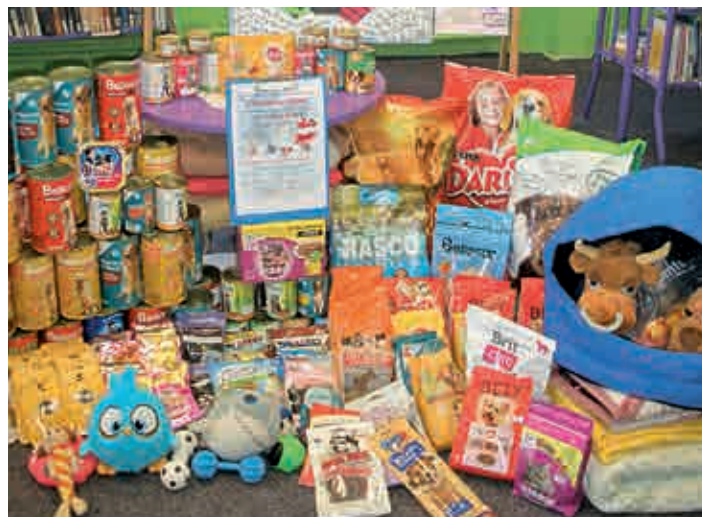
Sbírka pro útulek. ■ Ocenění žáci z I. stupně ZŠ Lom.