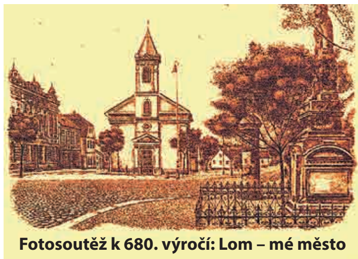
Fotosoutěž k 680. výročí: Lom – mé město

Zapátrat můžete i v albech rodičů či prarodičů, nebo kupříkladu ve své sbírce pohlednic. Zajímá nás vše, co se týká Lomu (Bruchu) a jeho nejbližšího okolí. I historické materiály bychom rádi ukázali především těm mladším, aby poznali, jak toto podkrušnohorské město bylo i v minulosti krásné.