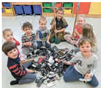
Dětem z MŠ Lom se podařilo „ulovit“ již na dvě stovky vysloužilých mobilních telefonů, které čeká další využití.

Prodlužuje se kampaň, která ukazujeme dětem, ale i dalším dospělým, jak chránit přírodu a využít ještě dosluhující techniku. Do konce března najdeme boxy na sběr starých mobilních telefonů na pobočkách Pošty PARTNER v Lomu i v Loučné a v mateřských školách v Lomu i v Loučné. Papírové boxy na vysloužilé mobily děti samy vyrobily v rámci projektu „Recyklohraní“. Kolektiv MŠ Lom děkuje všem, kteří již