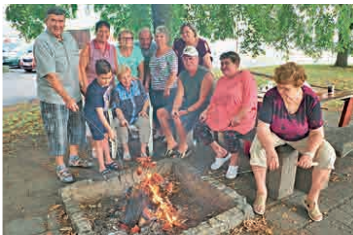
Během roku 2020 se lomským seniorům podařilo mimo jiné setkat se třikrát v užším kruhu při opékání špekáčků před restaurací Sokolovna.