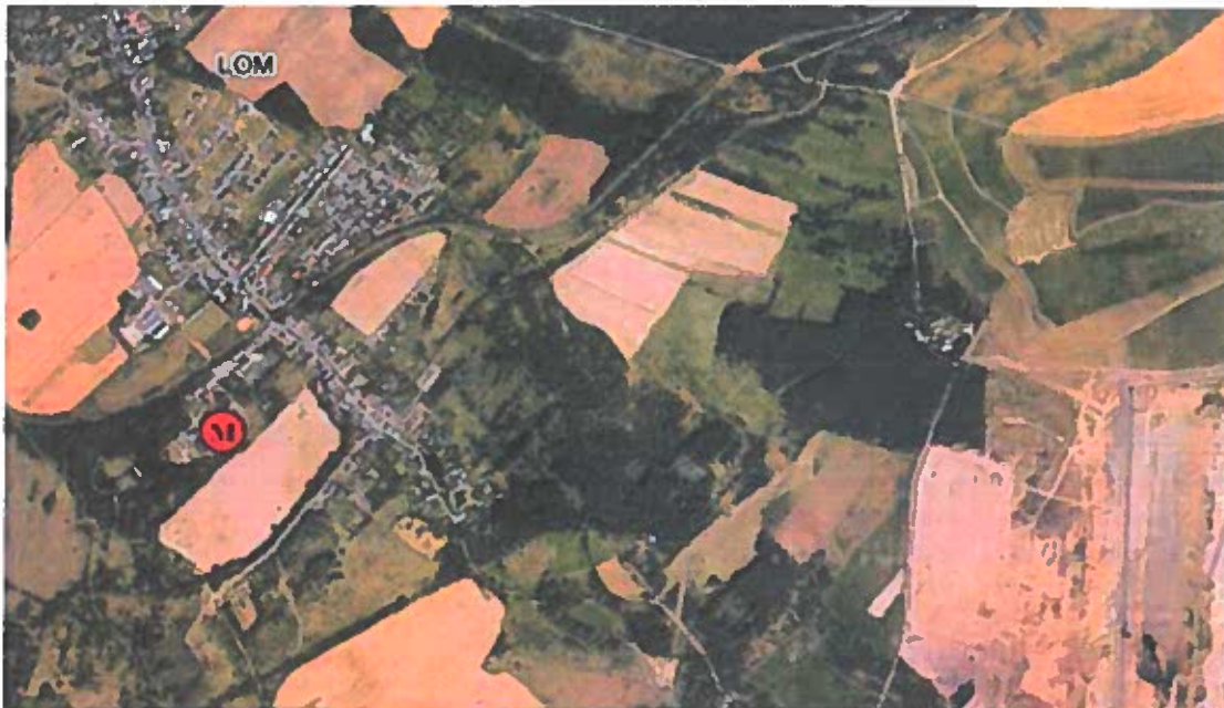
Obr. 1 Poloha měřicího místa v lokalitě – letecký snímek