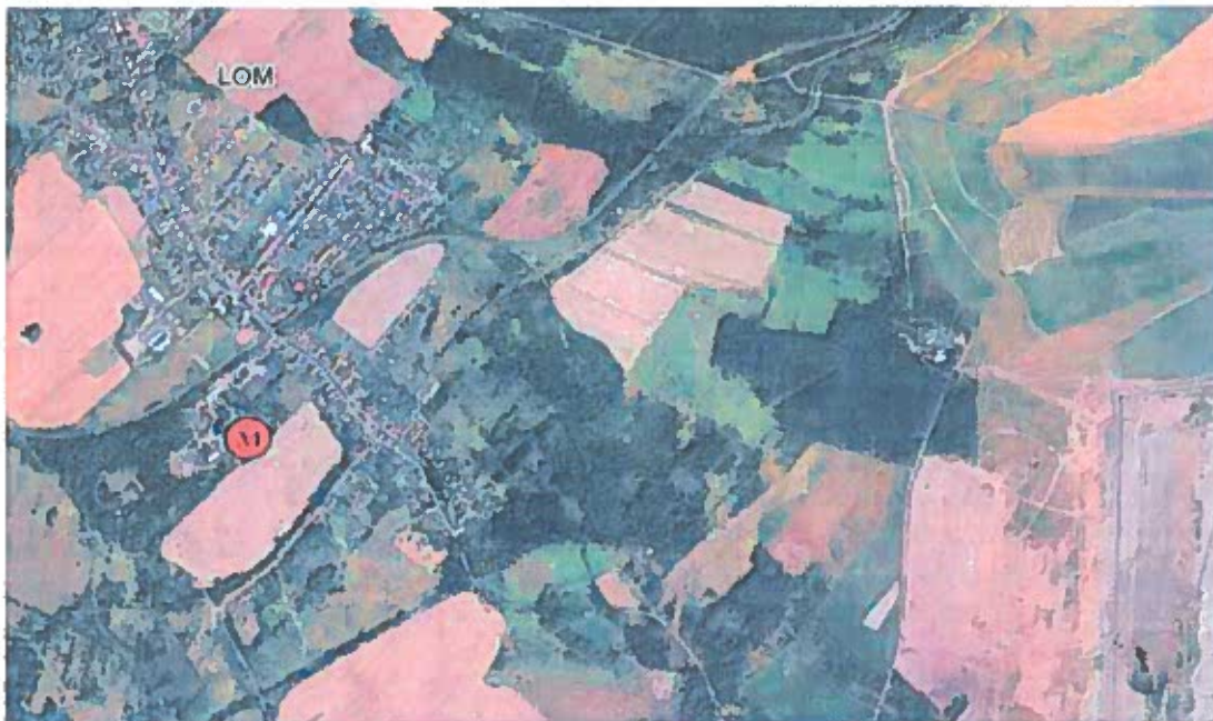
Obr. 1 Poloha měřicího místa v lokalitě – letecký snímek