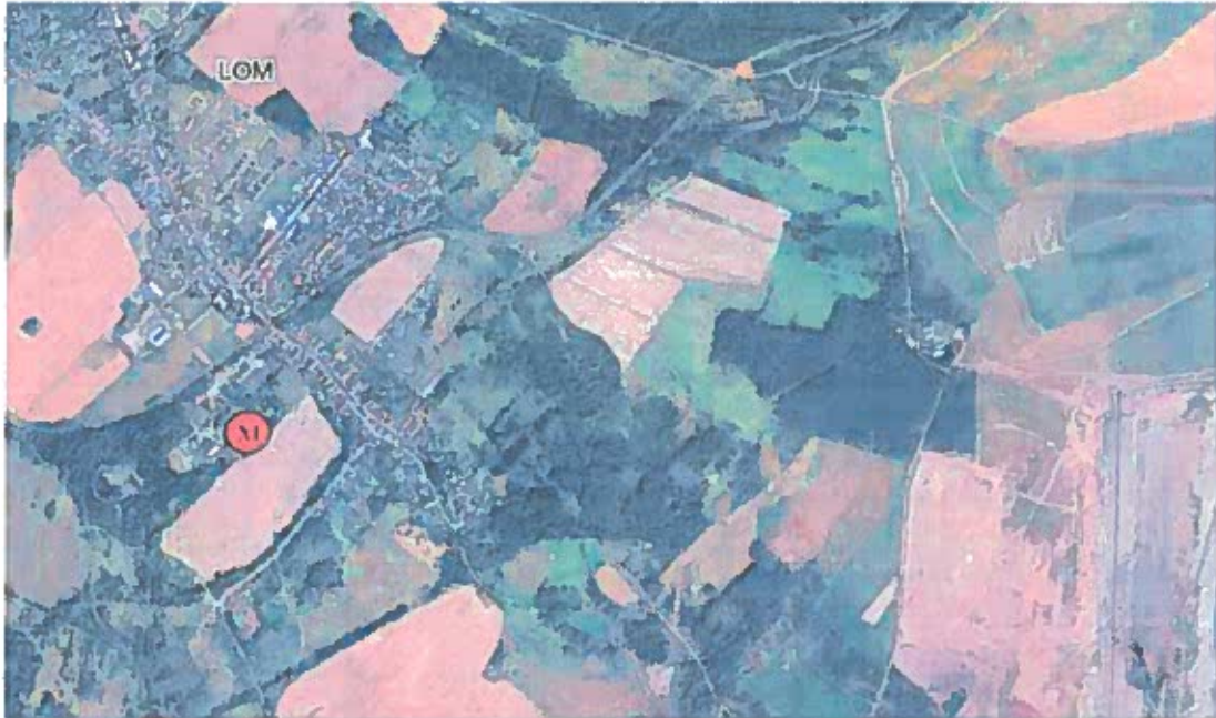
Obr. 1 Poloha měřicího místa v lokalitě – letecký snímek