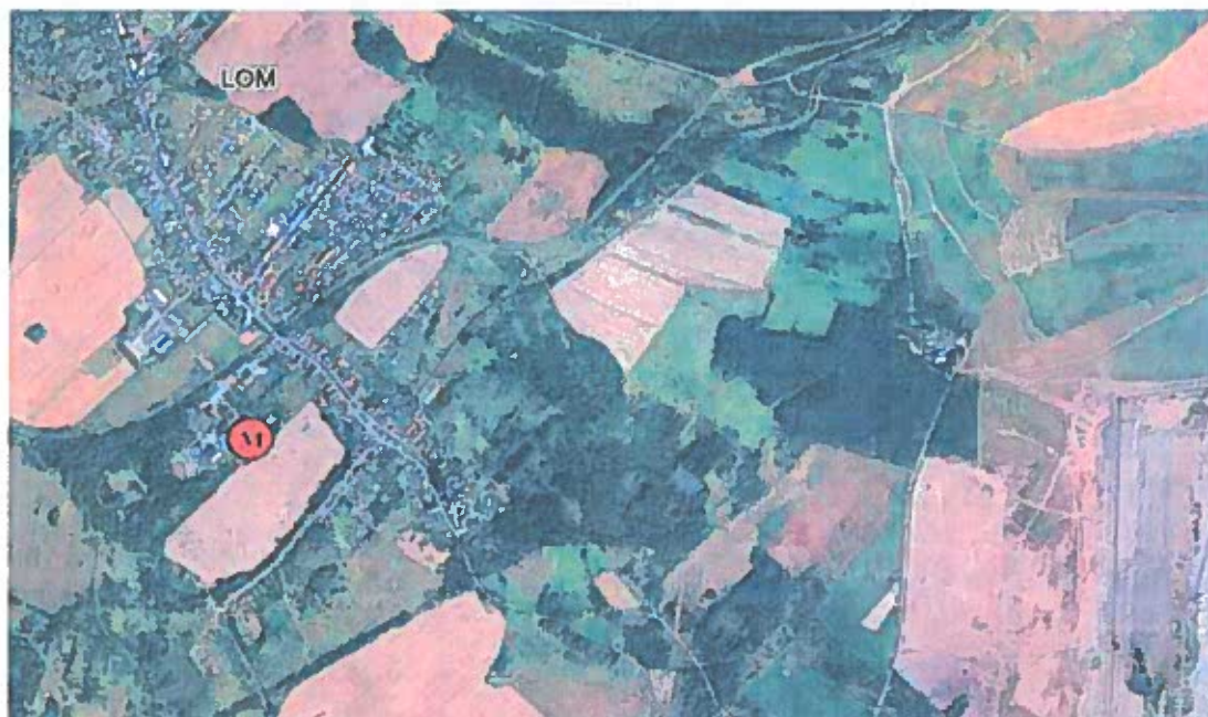
Obr. 1 Poloha měřicího místa v lokalitě – letecký snímek