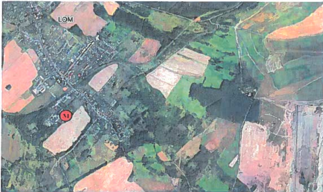
Obr. 1 Poloha měřicího místa v lokalitě – letecký snímek