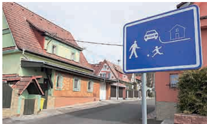
Maximálně dvacetikilometrovou rychlostí pak mohou vjezdět vozidla do obytné zóny kolem Havlíčkova náměstí.

ulice Novostavby, na ulici PKH před MŠ Loučná a například na Tyršově stezce.