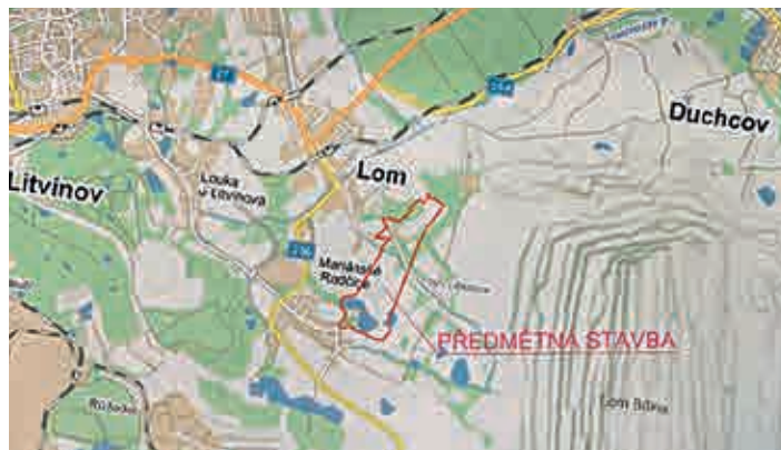
Orientační umístění záměru a širší vztahy s okolím. Území lesoparku navazuje na severovýchodní zónu obce Mariánské Radčice a na východní oblast intravilánu města Lom. Severní hranici lesoparku tvoří masív vzrostlé zeleně lokálního biocentra LBC570-1. Východně je vymezen hranou těžebního pole SD a.s. Doly Bílina, určenou pro stav v roce 2035.

okolních měst a obcí. „Realizace lesoparku by měla být započata v roce 2021 a doba přepokládané výstavby má být 12 měsíců,“ cituje z projektu starostka Kateřina Schwarzová a uzavírá: „Přejme si, aby se vše podařilo uskutečnit podle plánů.“