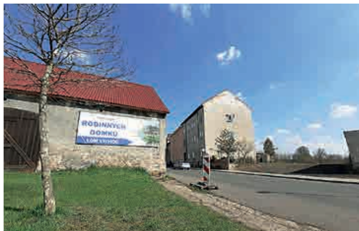
Billboard na objektu bývalého vodního mlýnu projíždějící i chodce na Vrchlického ulici upozorňuje, kde má vyrůst deset rodinných domů.

s užíváním příjezdové cesty s více vlastníky cesty. Nezkolaudovanému domu nemůže být například přiděleno číslo popisné.