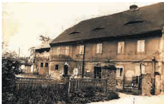
Dům č. p. 26

Střípky z naší minulosti: U Sieglů a u Reinelů