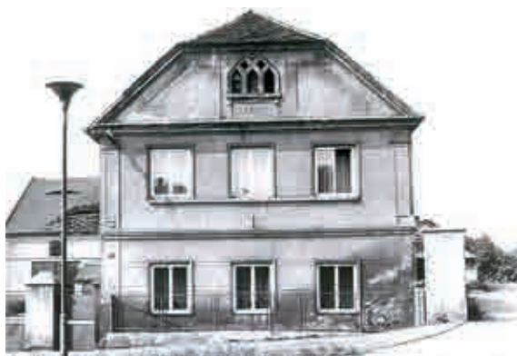
Dům č. p. 27