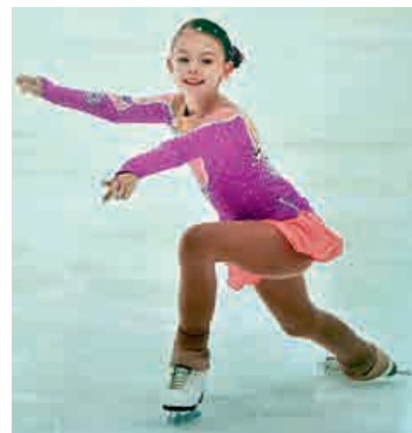
Závodní sezóna krasobruslařům začíná na rozhraní září a října, končí v závěru března. To bývají většinou každý víkend v jiném městě na závodech.

Jízdu pro každou krasobruslařku složí její trenérka na předem vybranou hudbu. Musí obsahovat předem určené krasobruslařské prvky platné pro konkrétní věkovou kategorii, do níž závodnice svým věkem spadá. Závodím v Poháru ČKS (Český krasobruslařský svaz) v kategorii mladších žaček.