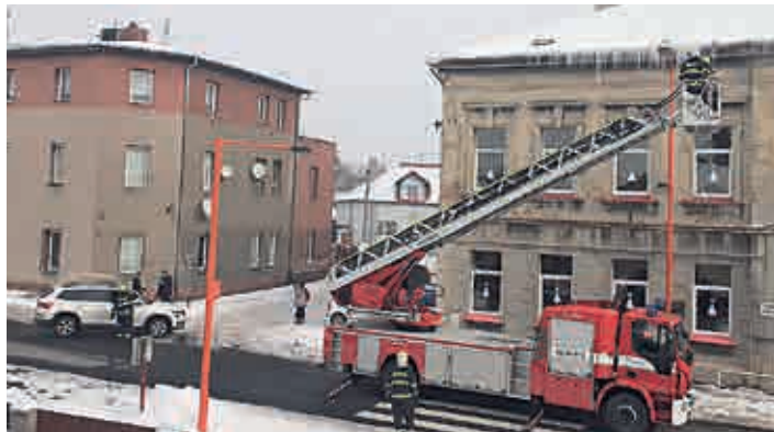
Členy jednotky SDH města Lom mohli obyvatelé vidět například při odstraňování rampouchů ze střechy základní školy. Dobrovolní hasiči absolvovali nedávno školení v dýmnici areálu Hlavní báňské záchranné stanice v Mostě.