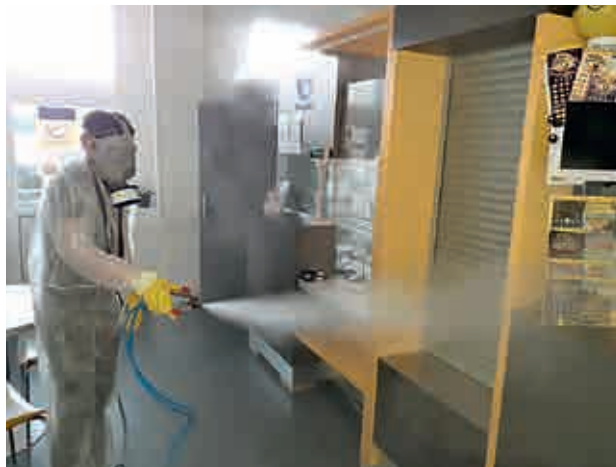
Pracovník společnosti Intera Litvínov během postřiku pětiprocentním roztokem peroxidu vodíku prostor Pošty PARTNER Lom u Mostu 1.