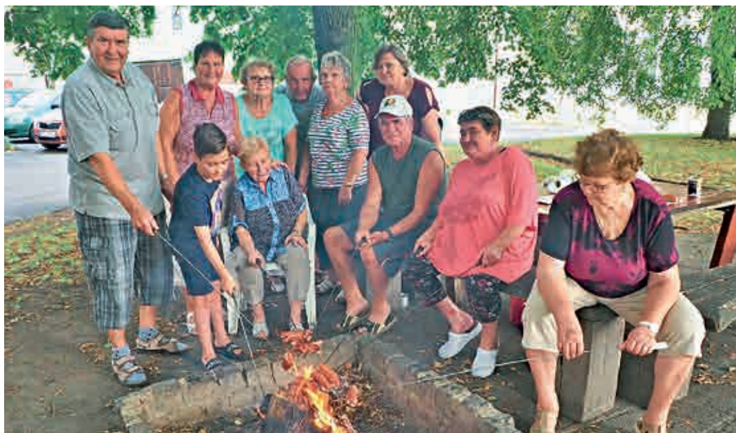
Osmnáctého srpna se uskutečnilo opékání špekáčků opět u lomské restaurace Sokolovna