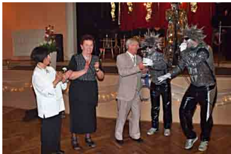
Lomští senioři se skupinou Electric Boogie