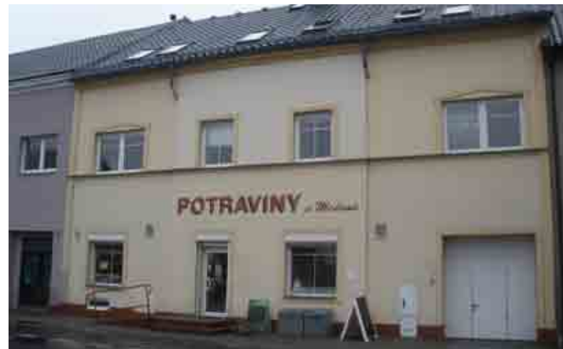
Potravinářství U Medunů

Když mi bylo 7 let tak si pamatuji, jak jsme na podzim byli s rodiči na výletě v Chebu a tam jsem se poprvé svezl na motokáře. Bylo to na tehdy teprve budovaném motokárovém okruhu, který dnes patří mezi nejmodernější v ČR. Ten zážitek mě nadchl natolik, že jsem se o tento sport začal zajímat a na jaře v roce 2009 jsem se stal členem závodního týmu HKC RACING Most a začal se závodit. V současné době jsem pilotem závodního týmu Spirit-racing Hradec Králové. Do loňského roku jsem jezdil kategorii Easykart, což je jízda na motokárách, které nelze nijak upravovat, po technické stránce jsou všechny stejné a tak záleží opravdu jen na umění každého jednotlivého jezdce, jak závod zajede, protože všichni mají stejné podmínky. Tato kategorie je perfektní pří-