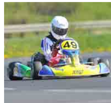
...a jeho motokára

A my ti budeme moc držet palce, abys uspěl a splnil si svůj velký sen a abys vše v pohodě zvládl – svého koníčka i studium. Děkujeme za rozhovor.