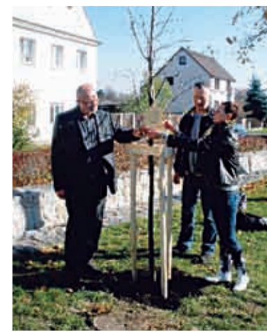
Tento projekt byl vytvořen za finanční podpory Nadace Partnerství, SFŽP ČR a MŽP