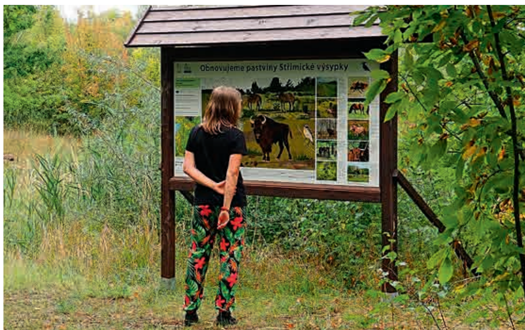
Návštěvnický okruh na Strimické výsypce