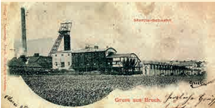
Důl Moritz dnes připomíná ulice Moritze Bauera, ležící v těsné blízkosti bývalého dolu, pojmenovaná po tehdejší členovi správní rady Lomské uhelné společnosti.

Vážení spoluobčané, v letošním roce oslaví naše město významné výročí, a to 685 let od první zmínky o jeho existenci. K výročí jsme vám připravili vědomostní soutěž, která bude uvedena v každém vydání Lomských listů v letošním roce. Zároveň si letos také připomeneme výročí 80 let od důlní katastrofy na dole Kohinoor I v roce 1946, která neblaze zasáhla do života většiny tehdejších lomských obyvatel.