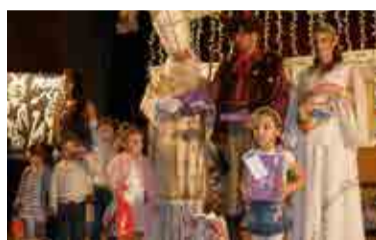
Pokračování na str. 4