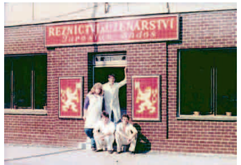
Původní osazenstvo a vzhled obchodu z roku 1993