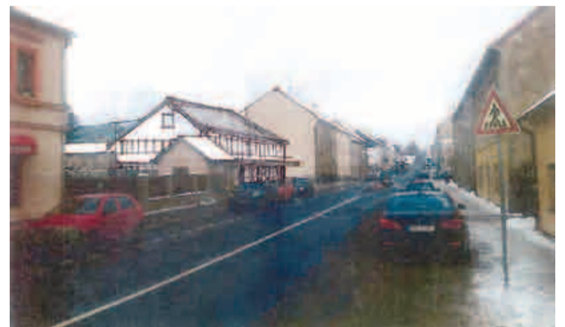
A takhle by mohla vypadat nová provozovna kuchyně a výroby lahudek

technologie a zpracování masa. Poté jsem se ještě vyučil uzenářem.