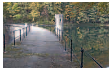
Údolní nádrž Jezeří

Údolní nádrž Jezeří na Vesnickém potoce se nachází v přírodní rezervaci Jezerka poblíž zámku Jezeří. Patří mezi hůře přístupné a byla postavena v le-