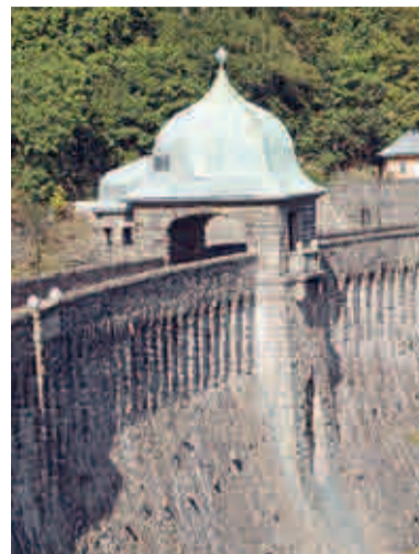
Vodní dílo Janov

Vodní dílo Janov leží 5 km od Litvínova v údolí potoka Loupnice. Bylo vybudováno v letech 1911–1914 s původním názvem Údolní přehrada královského města Most v Čechách. Stala se nejvyšší přehradou v tehdejší Rakousko-Uhersku. Je také jedna z mála