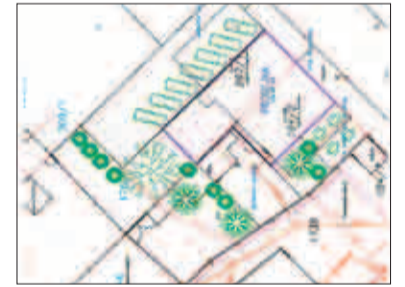
Plán nové provozovny