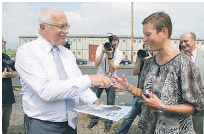
Prezident ČR, profesor Václav Klaus a starostka města Lom Kateřina Schwarzová při slavnostním zahájení provozu velkorypadla KK 1300, společností SD a. s. Chomutov na pracovišti v Duchcově dne 6. června 2011.