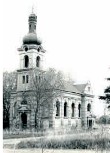
Kostel Sv. Michaela, 1998