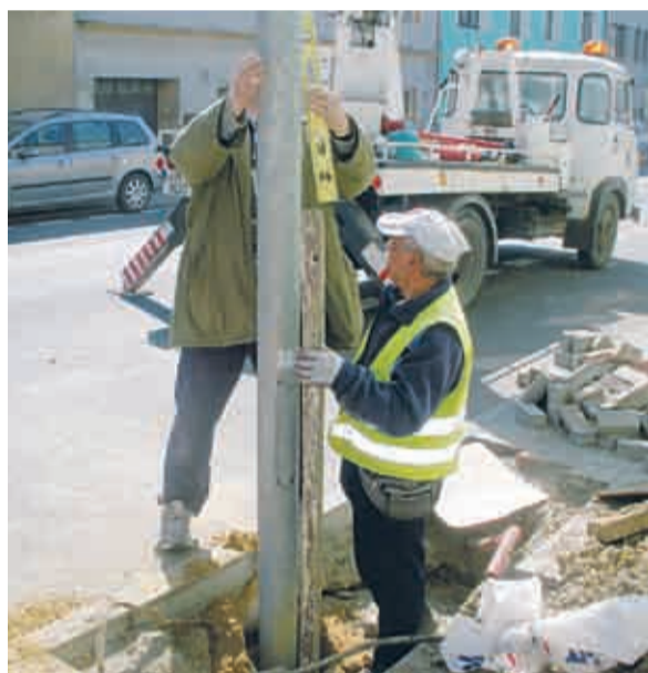
Rekonstrukce veřejného osvětlení v Lomu